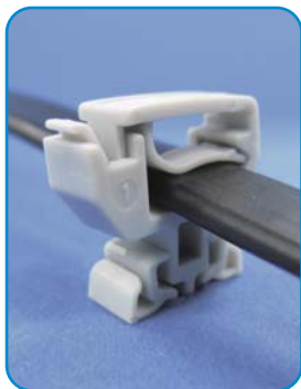
ケーブル本数が少ない場合