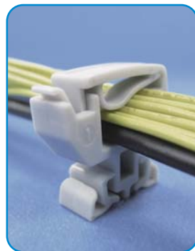
ケーブル本数が多い場合