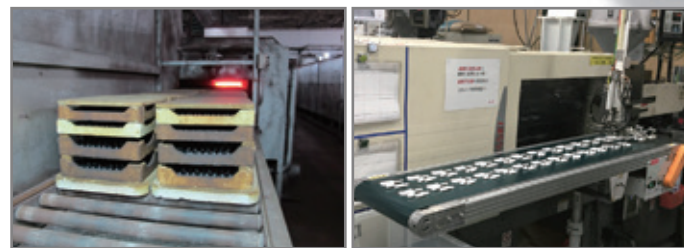
フェライトコア焼成