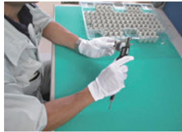
出荷前の外観寸法確認