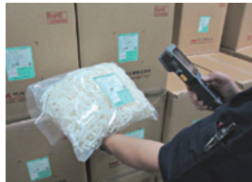
QRコード管理システム を導入