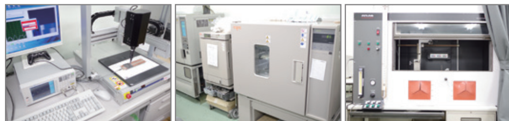
電磁波可視化システム